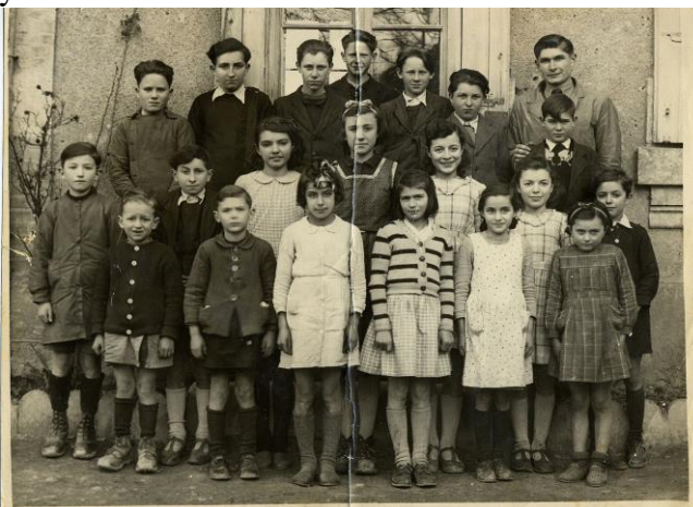
Élèves de Clermont-Pouyguillès en 1947 (p 101)

ACTA continue à essayer de retrouver les noms des enfants sur les photos du livre. Cette recherche se fait avec l'aide de personnes qui prennent le temps de communiquer la liste des noms et des prénoms. Il y en a bien d'autres à trouver. Merci d'aider ACTA.