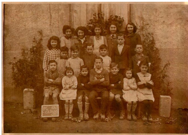
Élèves d'Idrac-Respaillès en 1947 (p 106)